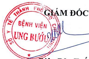
Diệp Bảo Tuấn